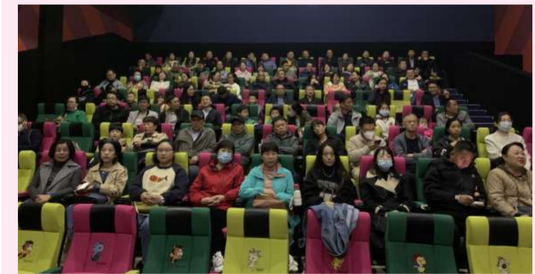
集团公司党委为深入开展主题教育活动，11月4日上午组织有关人员在漯河大北门影城观看红色教育电影《志愿军》。