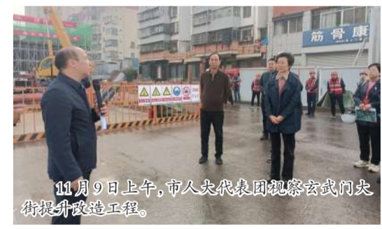
11月9日上午，市人大代表团视察玄武门大街提升改造工程。

听取了汇报后，人大副主任赵莉对工程建设情况所取得的成绩给予肯定，希望工程各参建方按照市委政府工作要求，全面开展项目攻坚行动，按照既定计划全线通车，尽早还路于民。（韩卫锋）