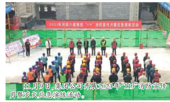
11月9日，集团公司开展2023年“119”消防宣传月暨灭火应急演练活动。