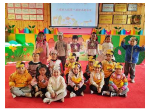
小小的舞台，大大的梦想。此次绘本剧表演活动锻炼了幼儿的语言表达能力，增强了幼儿的表演能力和自信心，同时也为幼儿提供一个展现自我的舞台。幼儿园将以此次表演活动为契机，开拓绘本阅读新思路，让绘本滋润童心，让幼儿爱上阅读，在书籍的海洋中尽情遨游。（幼儿园）

每一本绘本，都有精彩绝伦的故事。每一个孩子，都是天生的表演家（具有表演的天赋）。每一幕绘本表演，都是孩子一次有趣的尝试。11月23日，公司幼儿园开展了精彩绝伦的绘本剧表演活动。让幼儿以表演的形式融入故事，走进角色，获取真切的故事体验。