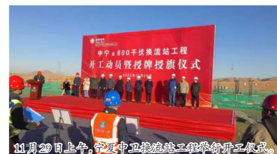
11月29日上午，宁夏中卫换流站工程举行开工仪式。

宁夏中卫中宁县800千伏换流站工程是沙戈荒地区首条外送特高压直流站工程，中宁士800千伏换流站位于宁夏回族自治区中卫市中宁县余丁乡，是宁夏一湖南工程的送端换流站，站址总占地33.44公顷，