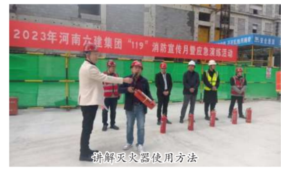
讲解灭火器使用方法